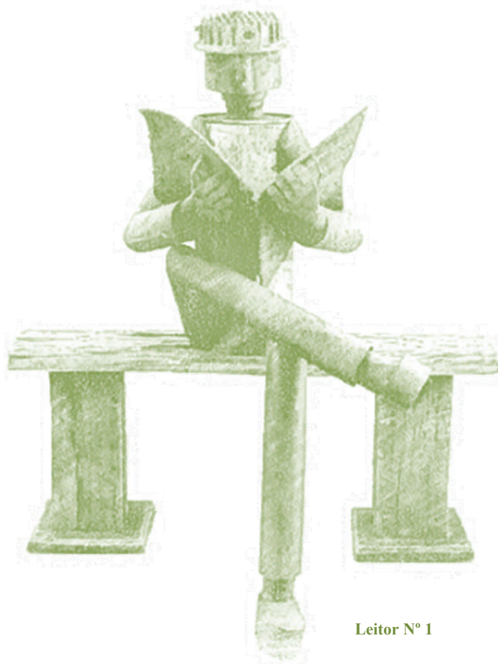
Leitor Nº 1