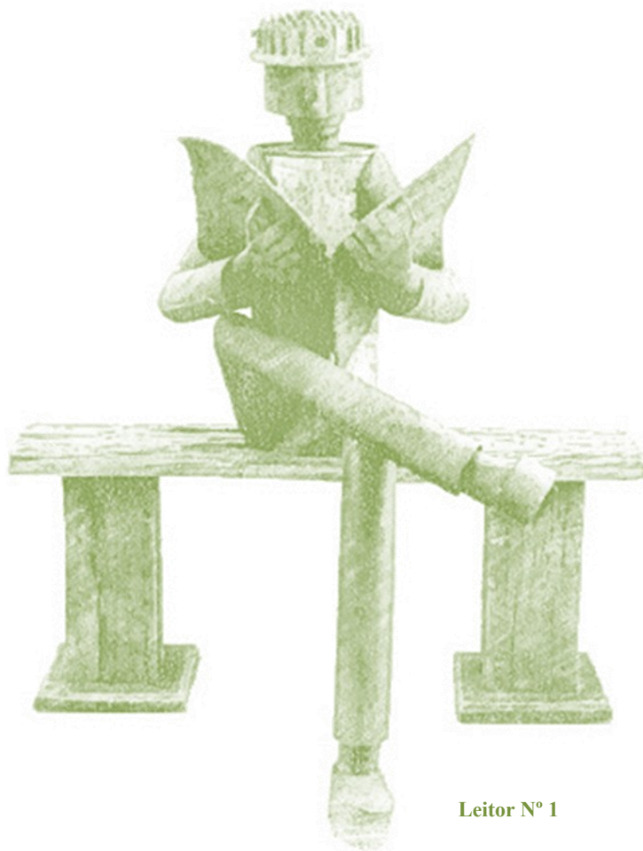
Leitor Nº 1