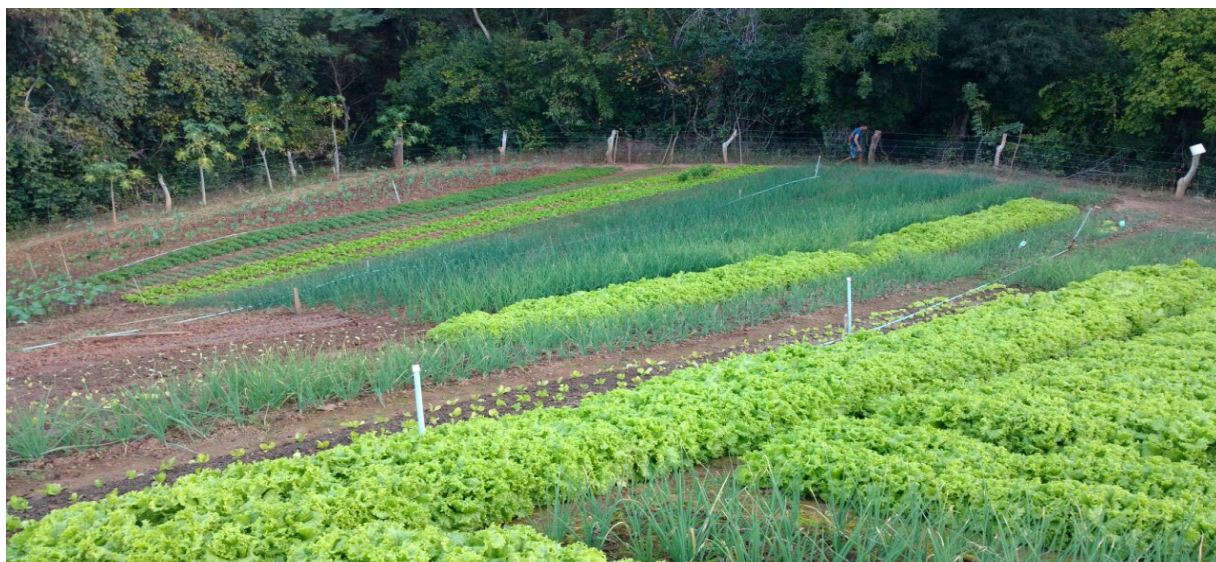
Figura 02 - Horta diversificada de agricultor familiar pertencente à ASPROHPEN

A figura que se segue ilustra a diversificação em uma das propriedades na comunidade de Planalto Rural.