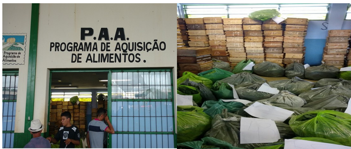
Figura 04: Entrega de produtos ao PAA na Ceanorte de Montes Claros.

Os mercados abriram, continuou os mesmos e outros, valorizou os mesmos, esses mercados que nos já tinha, o pessoal já preocupou. Eles falou: opa, pera aí, eles já tem outros compradores, esses pessoal já procurou outro mercado que é o PAA, eles já tem outra saída, que eles já não ta tao preso a nós, porque eles não são bobos, depois do PAA, eles falou: perai, eu tenho de ter um jogo de cintura para comprar desses agricultores agora. Os mercados novos que abriram que eu vejo, teve, mas o importante que valorizou os que nós já tinha e melhorou os preços dos produtos. O PAA tira o excesso, a palavra certa é essa. A gente não tinha segurança, o cara chegava e oferecia você tinha de vender (Morador E, 2017).