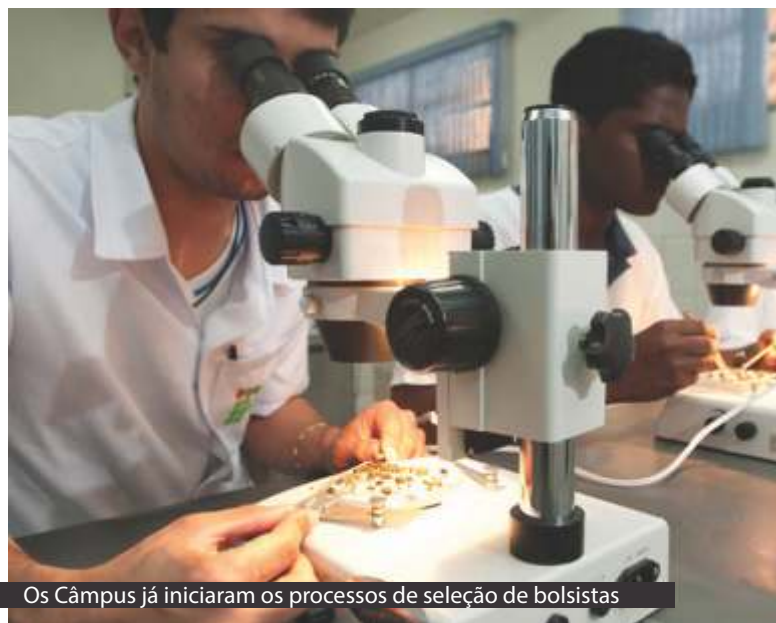
Os Câmpus já iniciaram os processos de seleção de bolsistas

O Comitê divulgará os valores das bolsas, de acordo com a modalidade e quantidade de bolsas previstas em cada exercício, conforme disponibilidade orçamentária. A seleção dos bolsistas será realizada por meio de edital a ser lançado a cada ano.